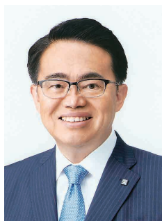
愛知県知事 大村 秀章

世界の資源・エネルギー需要や廃棄物は増加を続け、気候変動や生物多様性の低下など、地球環境問題も一層深刻となっています。2030年に向けて持続可能な社会を指向するSDGsが社会に浸透し、カーボンニュートラル、サーキュラーエコノミー、ネイチャーポジティブといった新たな概念が国際社会で共有されるなど、世界は大きく転換しつつあります。こうした世界の潮流の中で、愛知県においても環境と産業、暮らしの調和した持続可能な社会に向けて、産官学界が一丸となって、新たな社会の仕組みを創り出していかなければなりません。