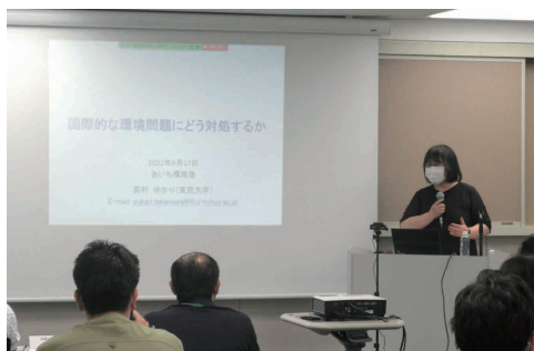
著名な講師による講演

卒塾生は、塾で学んだ知識や経験を生かし、それぞれの職場や地域での環境活動に取り組んでいます。また、塾生同士、アドバイザー講師、卒塾生、講師とのネットワークを卒塾後の活動に生かすことができます。2014年度からは、卒塾生等が中心となりNPO法人AKJ環境総合研究所を設立し、活動しています。