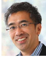
慶應義塾大学 大学院政策・メディア研究科 教授 蟹江 憲史氏