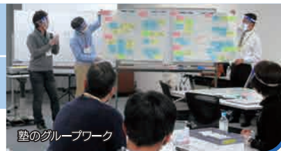
塾のグループワーク