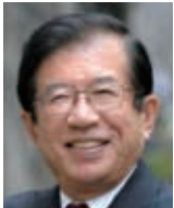
中部大学 総合工学研究所 特任教授 武田 邦彦氏