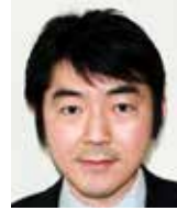
京都大学 大学院農学研究科 教授 栗山 浩一氏