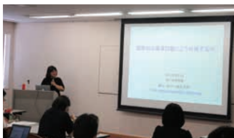
著名な講師による講義

卒塾生は、塾で学んだ環境に関する知識を生かし、職場改善や地域での環境活動に取り組んでいます。また、塾生同士、アドバイザー講師、卒塾生、講師とのネットワークが築かれるのも「塾」の目的であり、そのネットワークが卒塾後の活動に生かされています。卒塾生や地域社会を創る人たちの活動の場として、卒塾生等が中心となりNPO法人AKJ環境総合研究所を設立し、2014年度から活動しています。