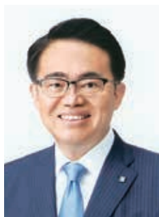
愛知県知事 大村 秀章

経済活動や日常生活による環境への負荷の増大や天然資源の枯渇などが懸念される今日、社会全体の仕組みを見直し、持続可能な社会を形成していくことが私たちの重要な課題となっています。