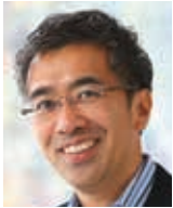
慶應義塾大学 大学院政策・メディア研究科 教授 蟹江 憲史氏