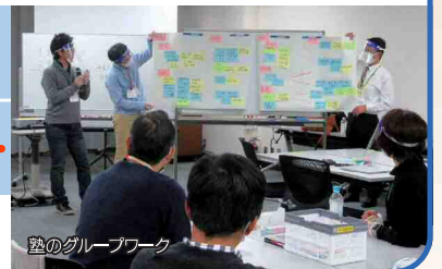
塾のグループワーク