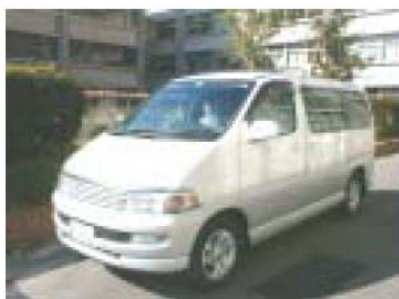
データ収集実験車