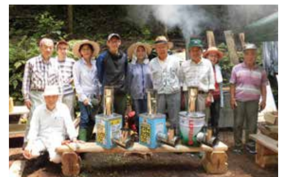
地元の方々の交流の場