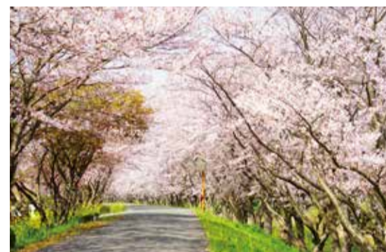
桜の咲く明るい参道のイメージ